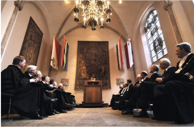
Unie van Utrecht-zaal (Aula van de Universiteit)

Nassau dat herinnert aan deze gebeurtenis. De Universiteit Utrecht werd opgericht in 1636 en kreeg de Unie van Utrecht-zaal als aula toegewezen.