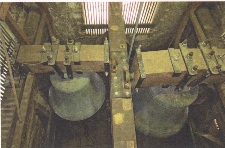
De klokken van de Geertekerk: Ghertrut en Jezus Maria Johannes.