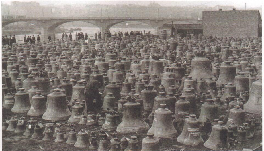
Klokkenkerkhof in de Tweede Wereldoorlog bij Hamburg.